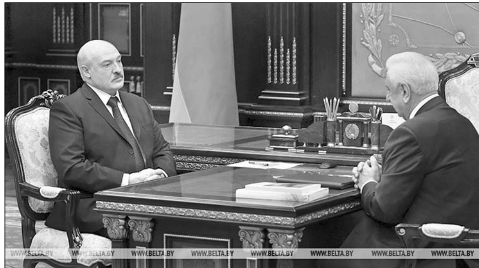
Александр Лукашенко и Михаил Мясникович

Александр Лукашенко предположил, что, возможно, в конце года главы государств смогут встретиться в очном формате. Ранее подобные перегово-