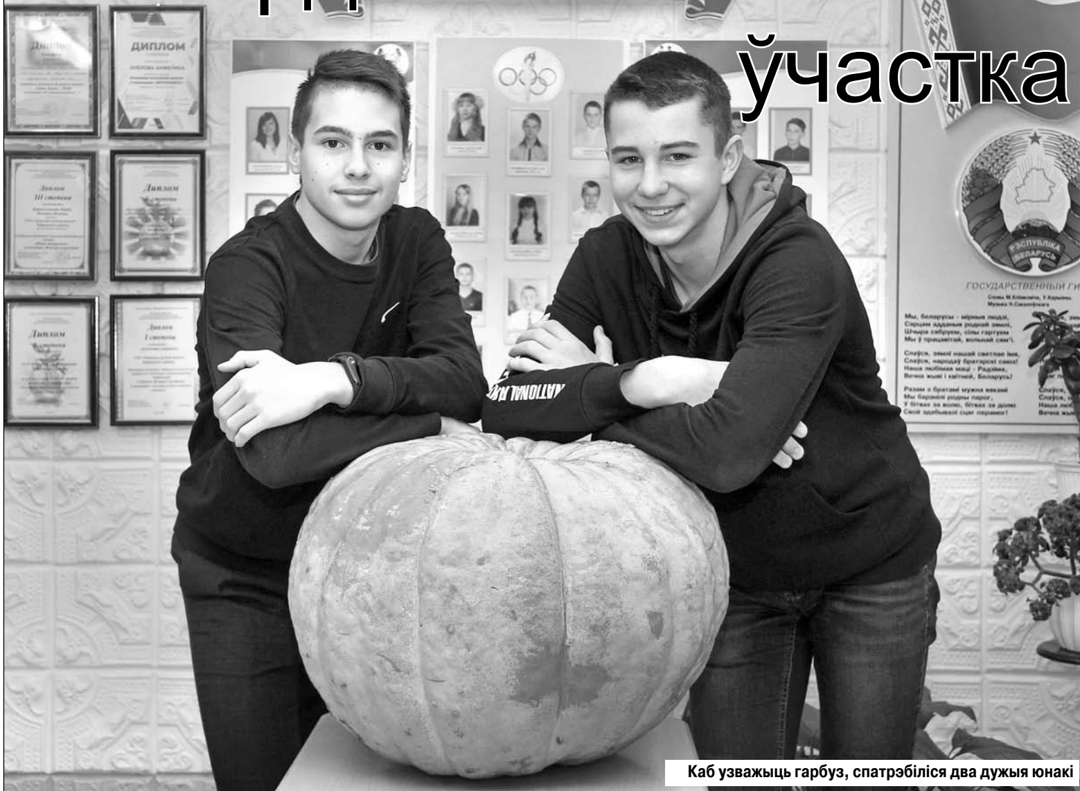
Каб узважыць гарбуз, спатрэбіліся два дужыя юнакі

Вучні Уцеўскай школы вырасталі 270 кілаграмаў цыбулі і вялізны гарбуз