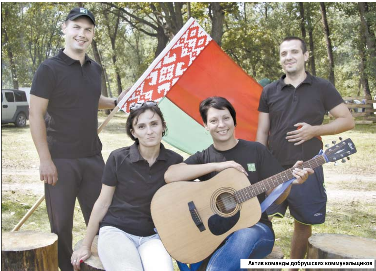
Актив команды добрушских коммунальщиков