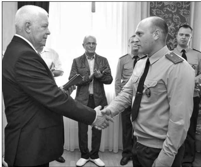
В момент награждения