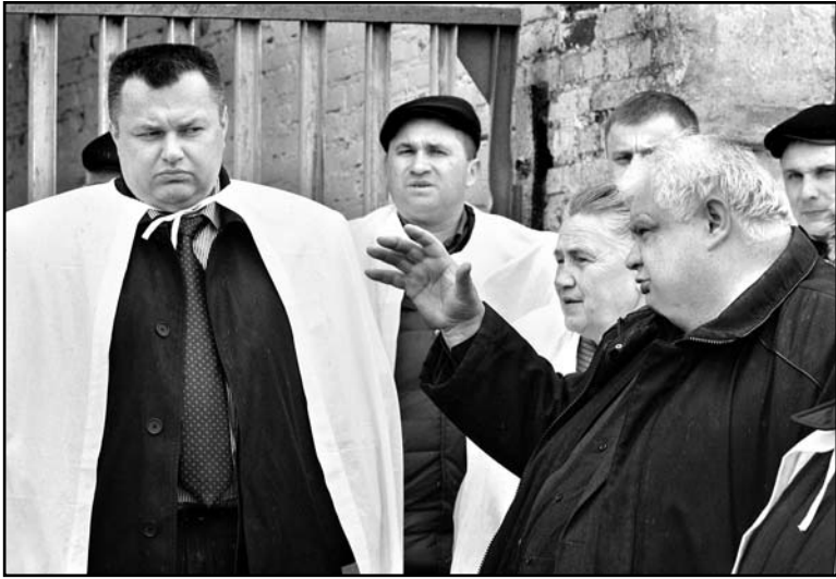
(Заканчэнне. Пачатак — на 1с.)

Удзельнікі семінара-нарады на комплексе наведлі цэх сухастою. Яго асаблівасць у тым, што ён раздзелены на два перыяды ўтрымання кароў – першай паловы сельнасі і другой. У другім перыядзе ўтрымання каровы атрымліваюць такое ж кармленне, як і ў цэху вытворчасці малака. Робіцца гэта для таго, каб каровы паступова прывыклі да звычайных рацыёнаў, пазбягалі стрэсаў.