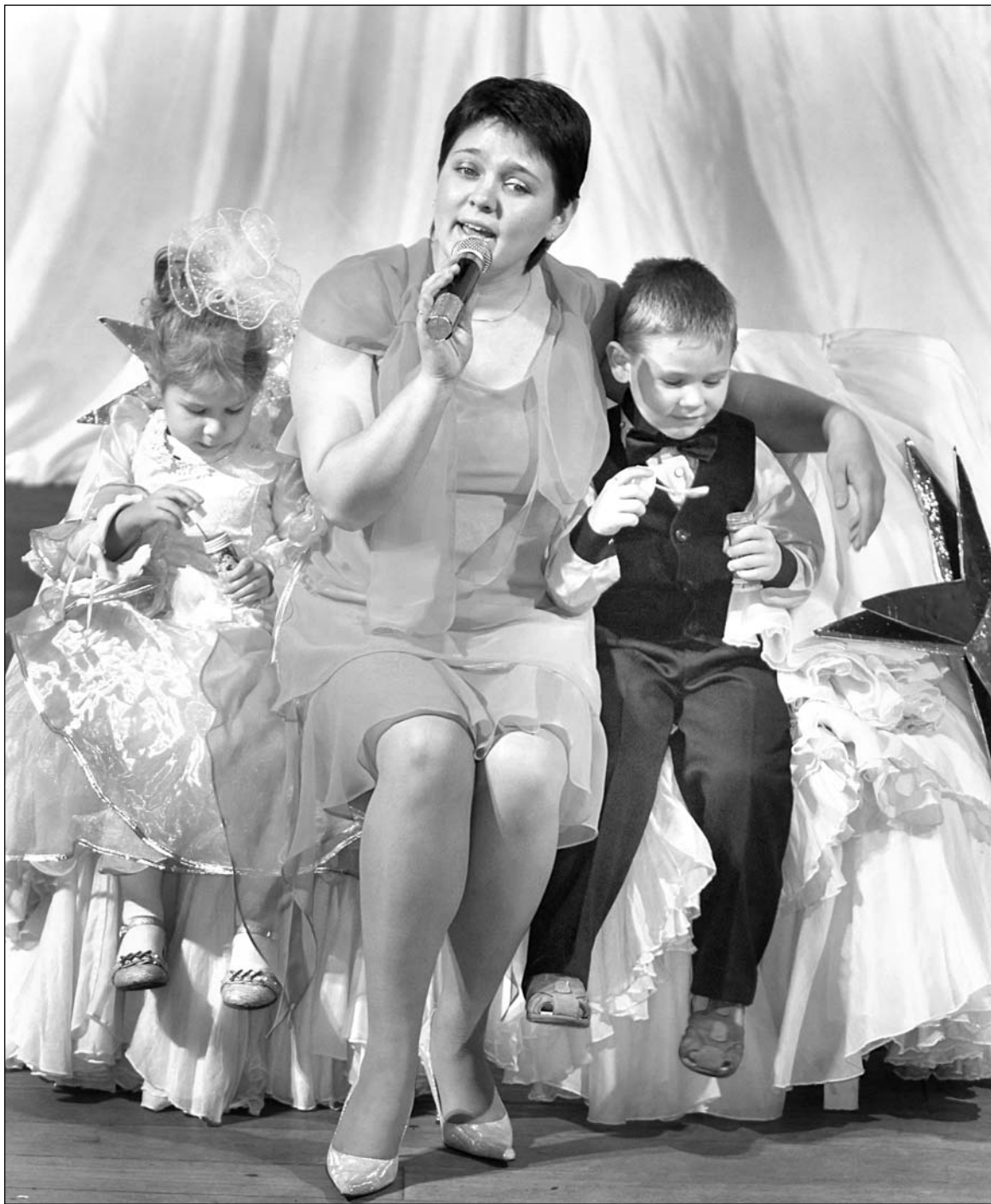
Днямі актавая зала раённага Дома культуры імя Куйбышава сабрала глядачоў і тых, хто прыйшоў падтрымаць удзельнікаў адборачнага тура штогадовага абласнога конкурсу "Лепшая маладая сям'я Гомельшчыны".

Перад пачаткам мерапрыемства дабрुшане і госці горада змаглі палюбавацца выставай, падрыхтаванай сем'ямі-ўдзельніцамі конкурсу. На палічках былі прадстаўлены вырабы мам, тат і дзяцей, фотальбомы, генеалагічныя дрэвы, кулінарныя стравы і салодкія прысмакі.