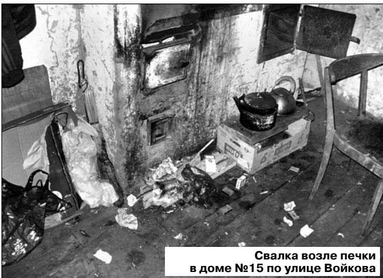
Свалка возле печи в доме №15 по улице Войкова