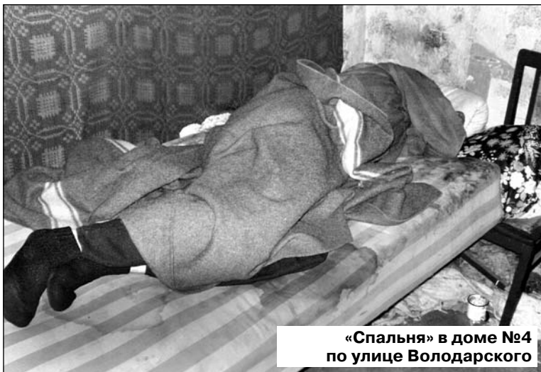
«Спальня» в доме №4 по улице Володарского

По его словам, это дом матери. Старушке ночью стало плохо, пришлось скорую вызывать, везти ее в больницу. Теперь вот прилег отдохнуть. А что касается вопросов пожарной безопасности, то, по его мнению, все не так уж и плохо. Печка новая, и это правда: она хоть не побелена, зато трещин пока нет. Но это – единственный просвет в этом убогом, запущенном помещении, доведенном не обремененным работой, семьей и бытом детиной «до ручки».