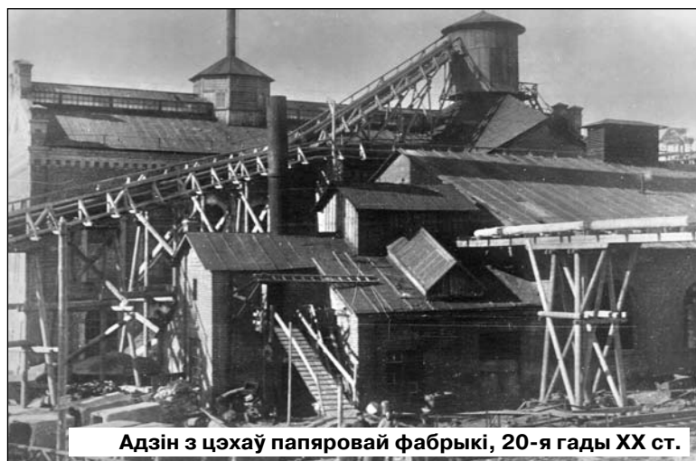
Адзін з цэхаў папяровай фабрыкі, 20-я гады ХХ ст.

Матэрыял падрыхтаваў пры дапамозе супрацоўнікаў раённага краязнаўчага музея Леанід ДУБОЎСКІ