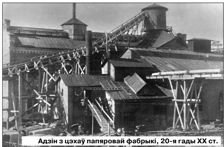
Адзін з цэхаў папяровай фабрыкі, 20-я гады ХХ ст.

Матэрыял падрыхтаваў пры дапамозе супрацоўнікаў раённага краязнаўчага музея Леанід ДУБОЎСКІ