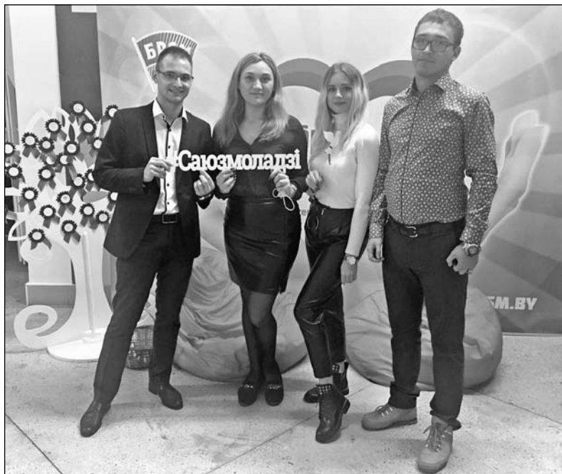
Представители добрушской делегации

Активисты БРСМ также раздавали сувениры с национальной символикой. Желающие под присмотром мастеров мог-