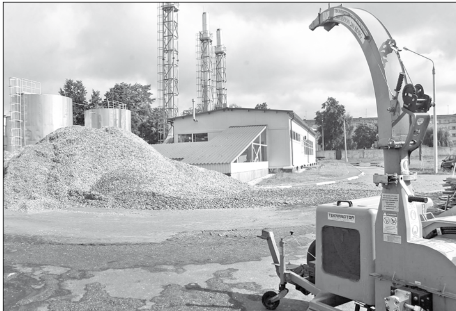
Той самы “Скарпіён”

Гледзячы, як пальцы аператара хутка бегаюць па сэнсарным экране