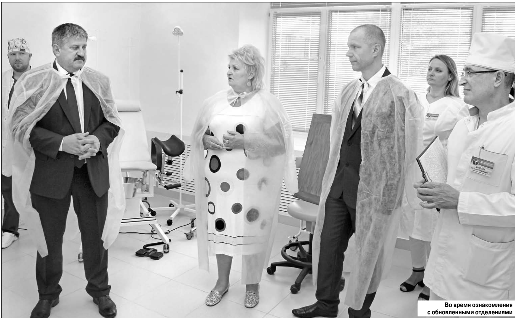
Во время ознакомления с обновленными отделениями