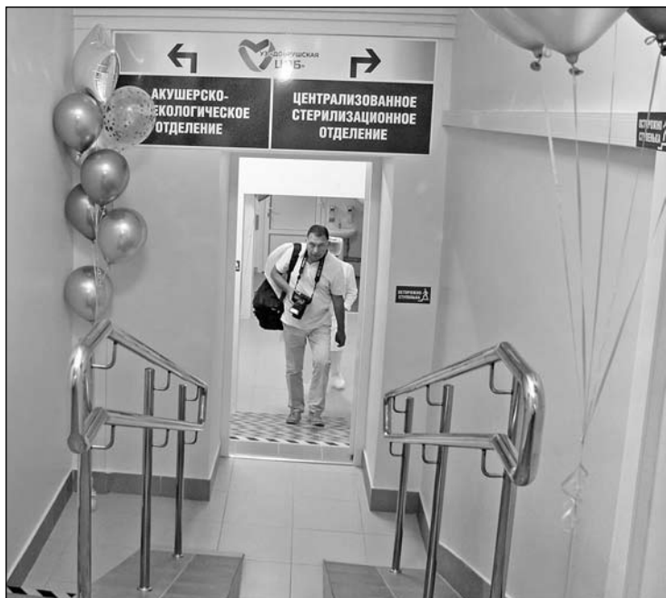
Порядок и комфорт – со входа в отделения