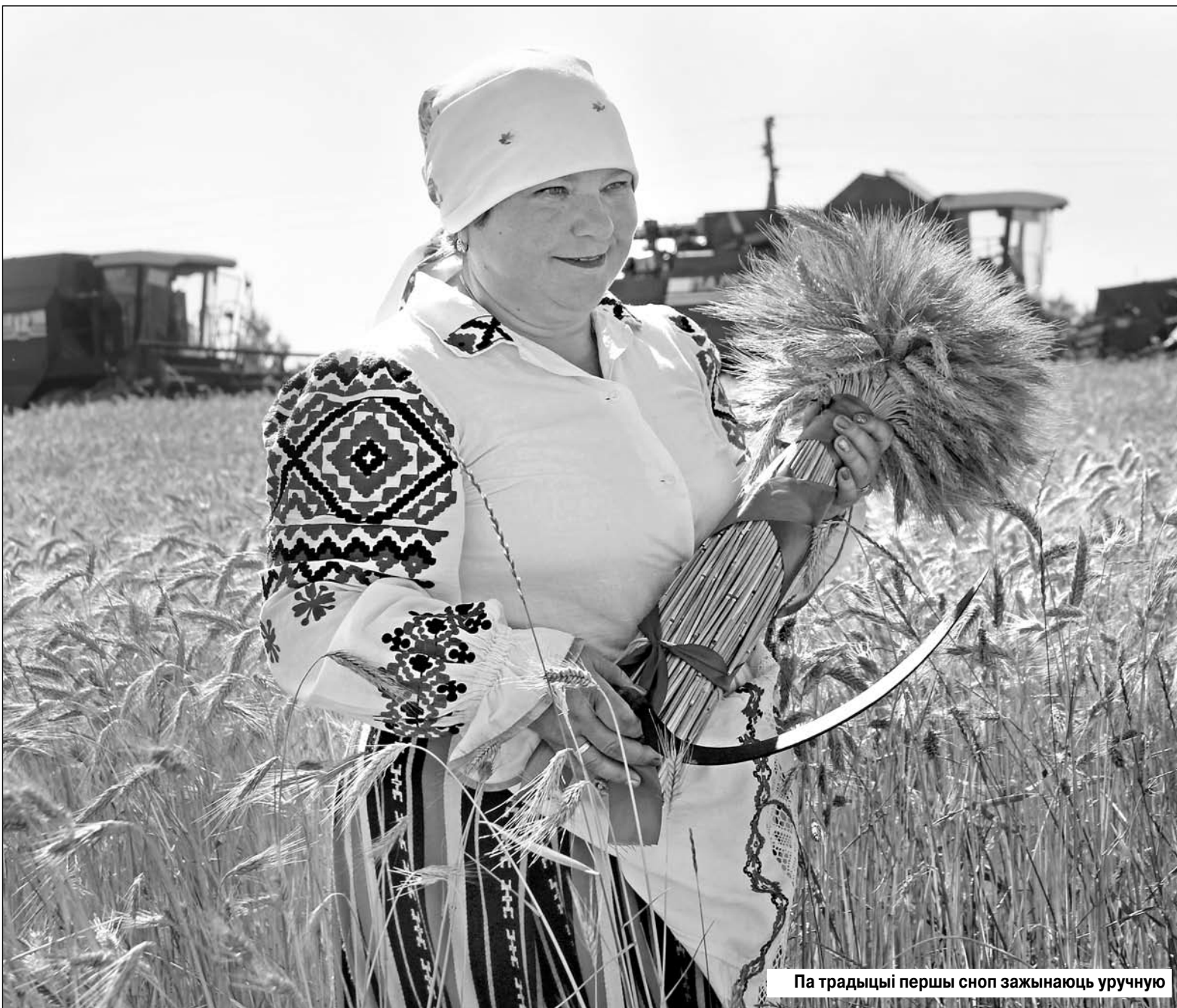
Па традыцыі першы сноп зажынаюць уручную