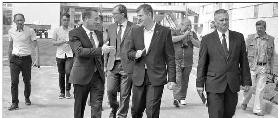
Посещение фарфорового завода