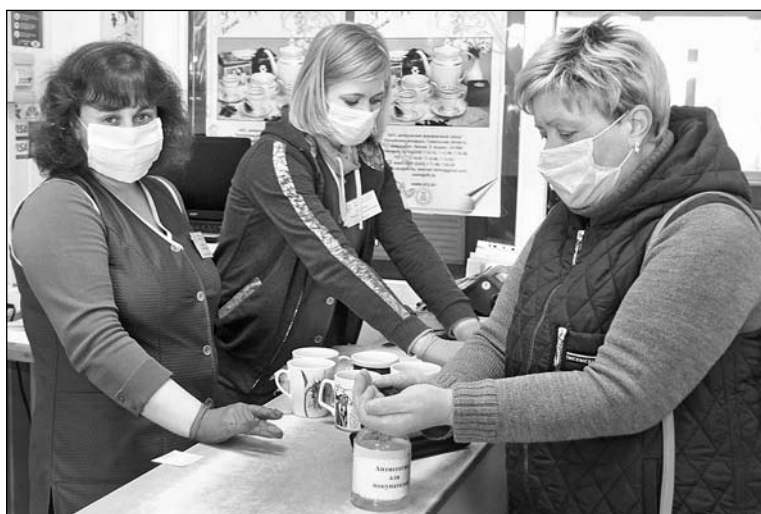
В фирменном магазине фарфорового завода

Как рассказали в райЦГЭ, разделительные полосы, указывающие необходимую дистанцию для покупателей, – единственная мера профилактики, которую ввели в магазине «Соседи». Представителя торгового объекта вызвали на заседание комиссии. Причина – не только нарушения в организации профилактики, но и невыполнение требований к