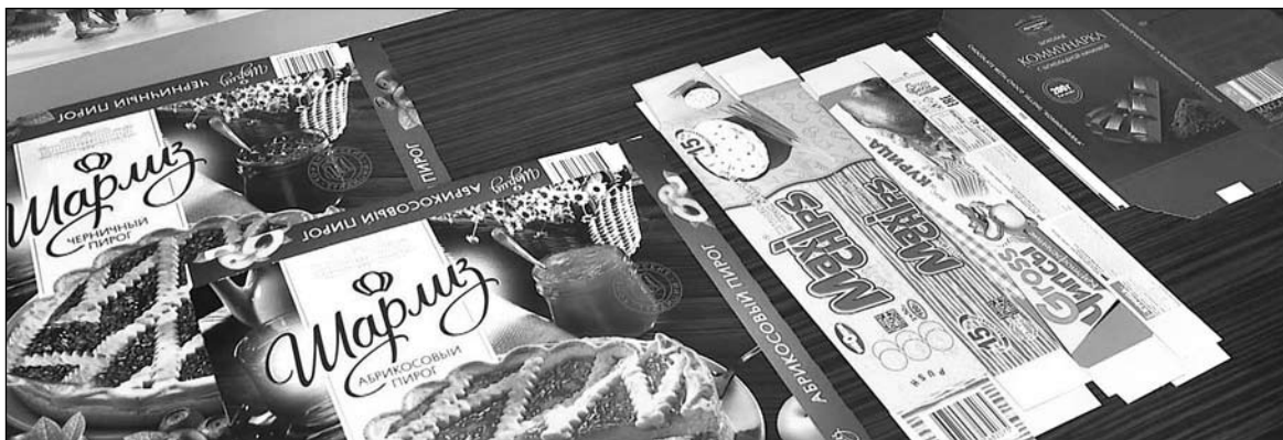
Сырье для такой упаковки могут производить в Добруше

Николай ЖДАНОВИЧ