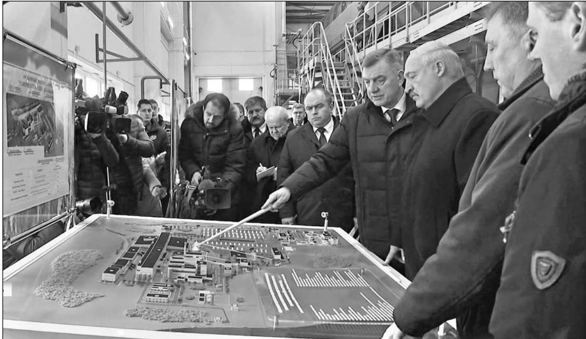
Во время визита Президента

Президент страны подписал Указ о завершении инвестпроекта на добрушской бумажной фабрике