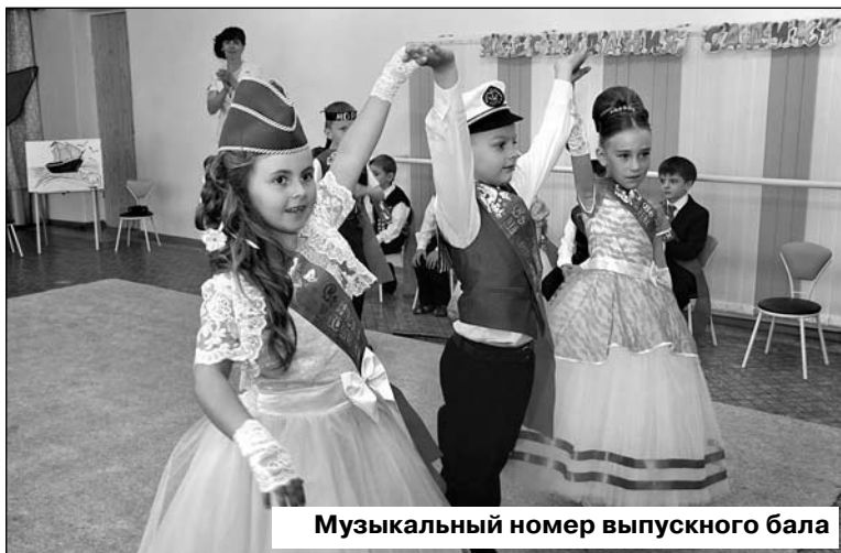
Музыкальный номер выпускного бала